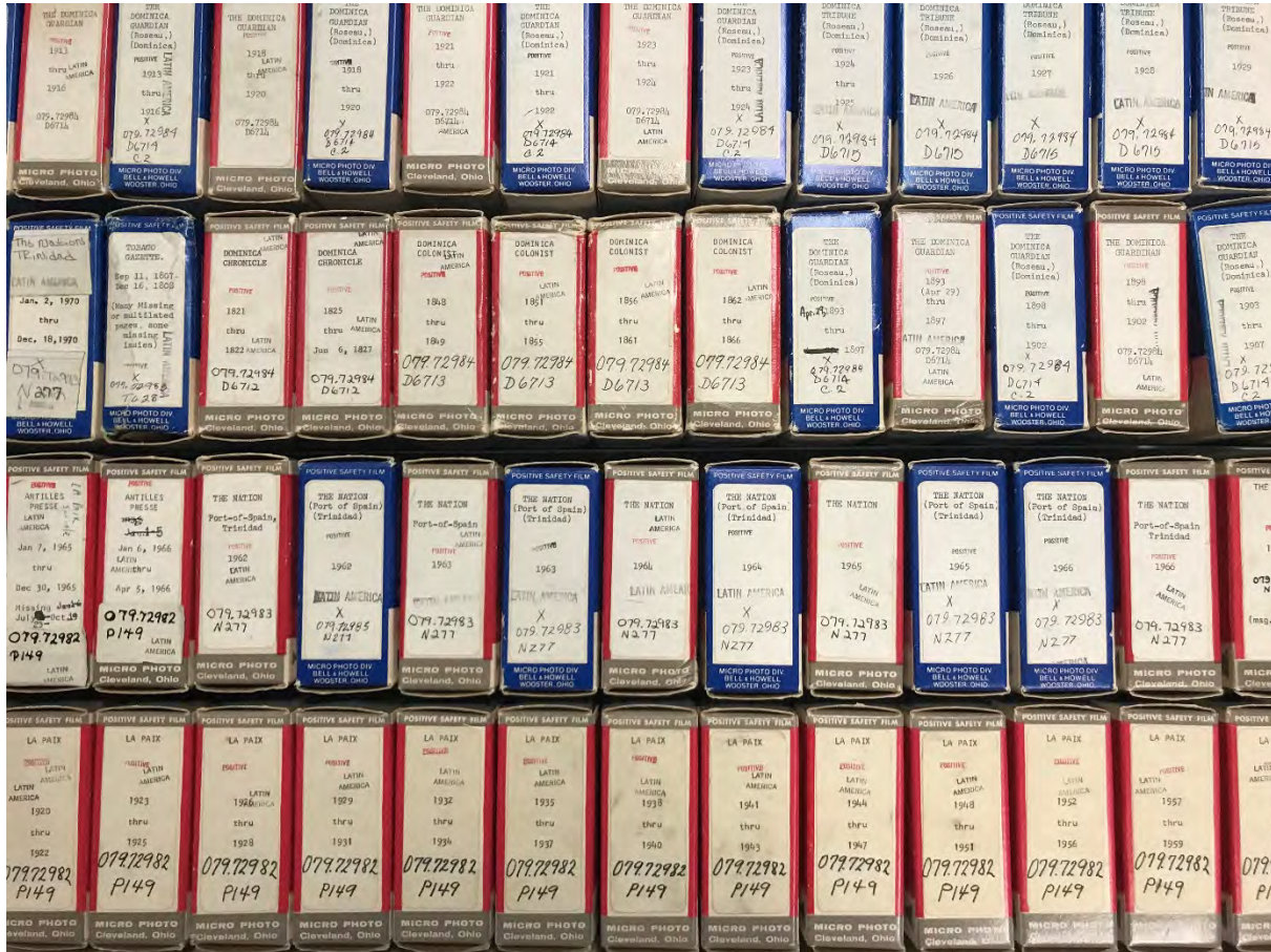
Microfilm reels for the Dominica Guardian and other Caribbean newspapers, from the Latin American and Caribbean Collections Library at UF, in the microfilm cabinets for access copies. Photograph taken 30 March 2018.

The Dominica Guardian newspaper reels were microfilmed by UF in 1962 from the originals in the files of the Court House of Dominica, BWI. The physical holdings are within the microfilm cabinets, with the other microfilm reels. The records for these reels are brief in the UF catalog and WorldCat.